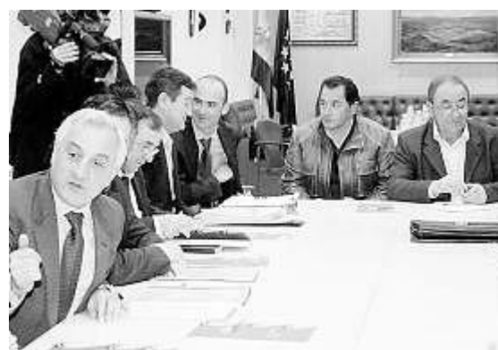
El Ministerio aconseja a la flota que pesque anchoa, porque no se reabrirá la xarda