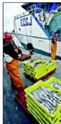
Descarga, ayer, en Avilés.